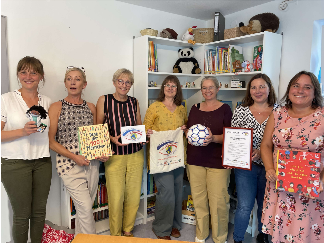
Zertifizierung eine Welt Kita