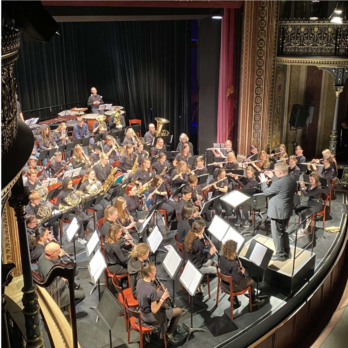
Wind Project 2023 - gemeinsames Konzert mit SJO Königsbrunn im Parktheater Göggingen